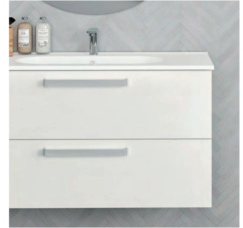
9034 Tirador Inox Mate / Inox Matt Handle

8735 Mb BONDI 100 2C 3806 Lav ADA 100 7215 Esp LISS 90 9032 Tirador BONDI Blanco