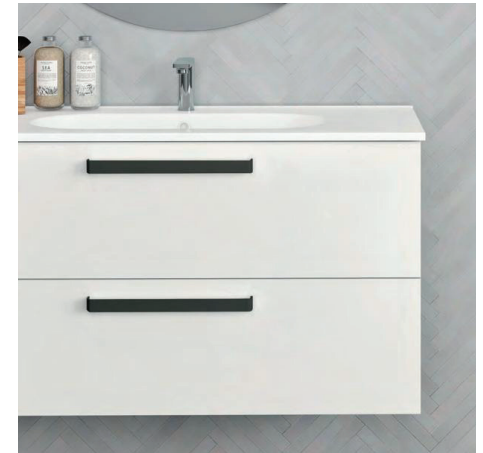
9033 Tirador Negro / Black Handle